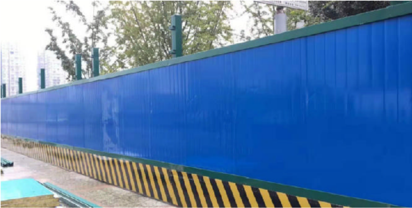
彩钢板围蔽效果图